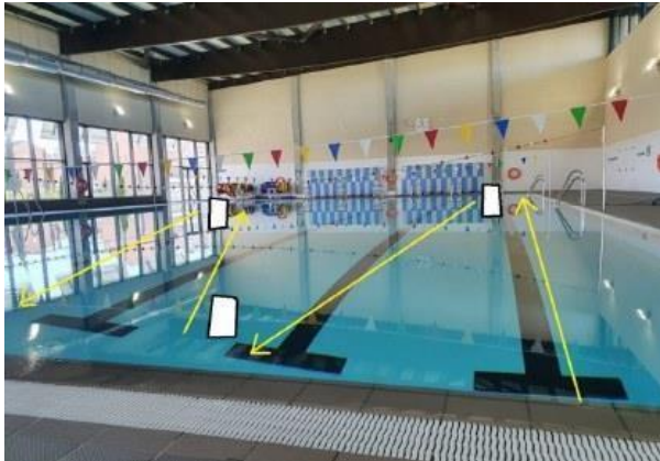
2 - NATACIÓN