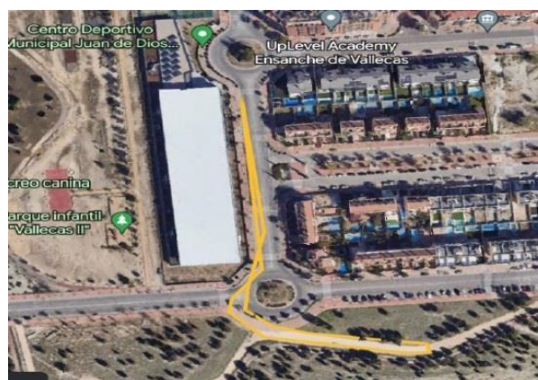
4 - CARRERA A PIE