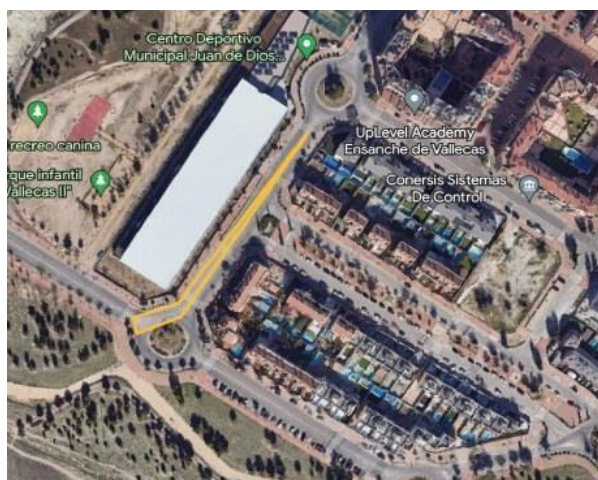
1 - CARRERA A PIE